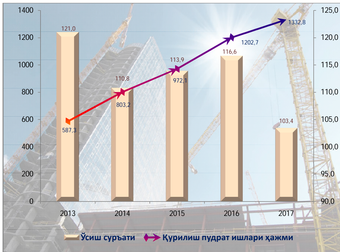
1-диаграмма - Қурилиш-пудрат ишлар ҳажми

Сурхондарё вилоятида 2017 йил январь-сентябрь ойларида жами қурилиш-пудрат ишлар ҳажмлари 1332,8 млрд.сўмни, ўтган йилнинг шу даврига нисбатан 103,4 фоизни ташкил этди.